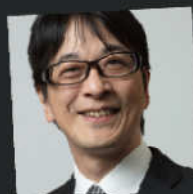
soezimax 元 YouTube アンバサダー 映画監督・俳優 / 登録者 3.6 万人