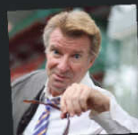
Ericurf6 日本の文化・食事を紹介 登録者 75.4 万人