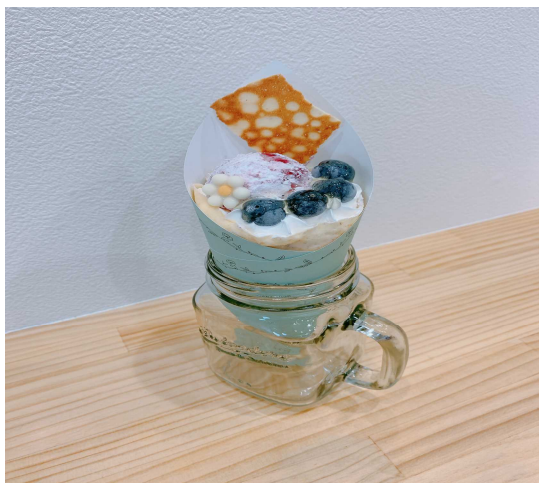
くまとりクレープ オ ブルーベリー