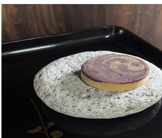
御門・ショコラタルト