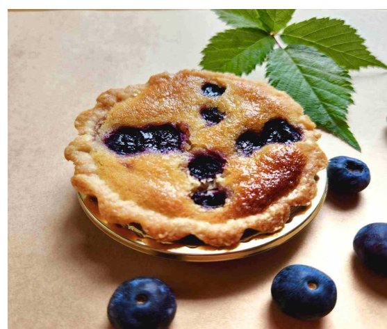
ベアベリータルト