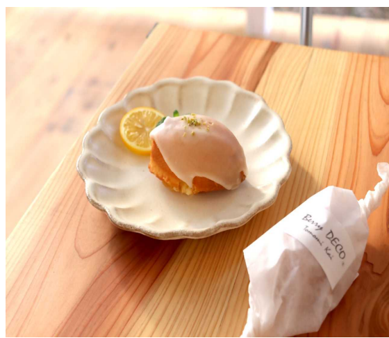
熊取ORSO BAKE レモンケーキ