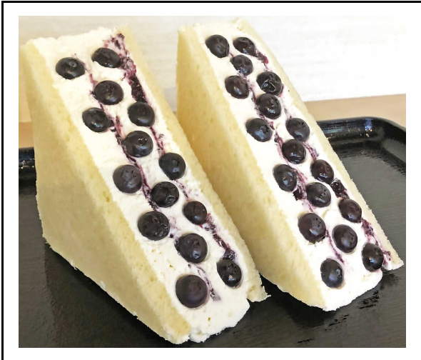
ブルーベリーフルーツサンド