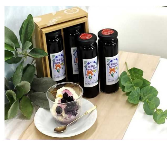
ブルーベリーコンポート