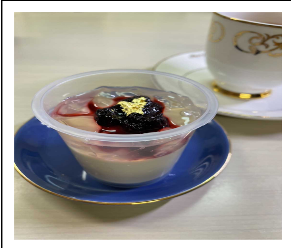
くまとりブルーベリープリン