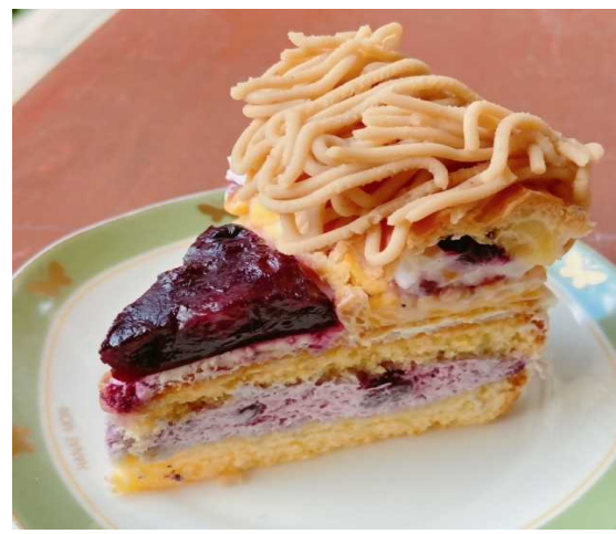
ベリーシュークラフト