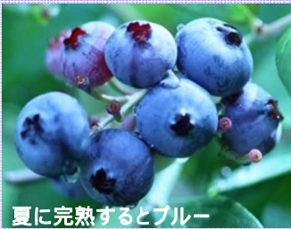
夏に完熟するとブルー