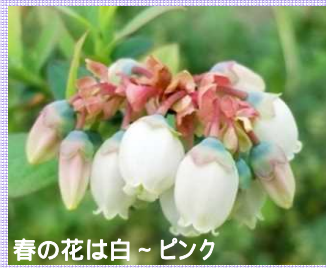
春の花は白～ピンク

鳥たちには食べられないよう、虫たちには中に入って受粉してもらえよう、ネットで囲っています！