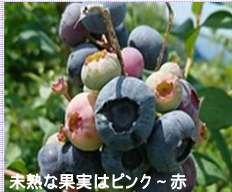
未熟な果実はピンク～赤