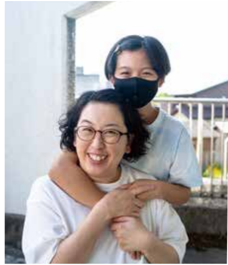
※写真掲載については本人の同意を得ています。

仕方がないのですが、なるべく本人の気持ちや大事にしてあげたい気持ちもあり、その葛藤がともしんどかったですね。