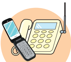
電話機、携帯電話 PHS端末