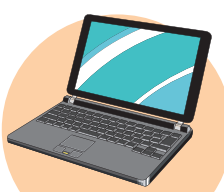
パソコン (ノートブック型のみ)

デジタルオーディオプレーヤー(フラッシュメモリ・HDD)、デッキを除くテーブルコーダー、MDプレーヤー、CDプレーヤー、ICレコーダー、ヘッドホン、イヤホン