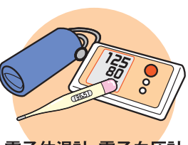
電子体温計、電子血圧計 補聴器