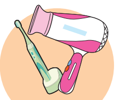
理容用電気機械器具