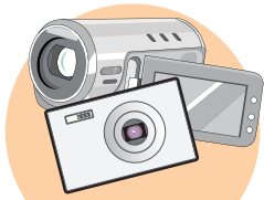
デジタルカメラ ビデオカメラ