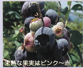
未熟な果実はピンク~赤