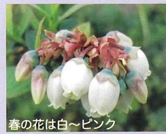
春の花は白~ピンク