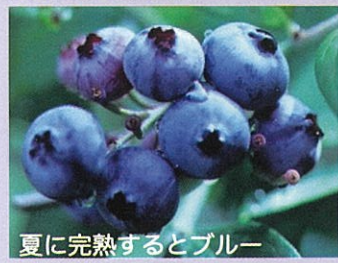
夏に完熟するとブルー