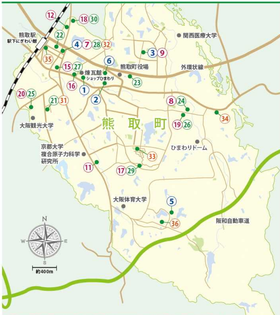
⑩、⑬、⑭は移動店舗のため地図には掲載されておりません。それぞれの連絡先にお問い合わせください。