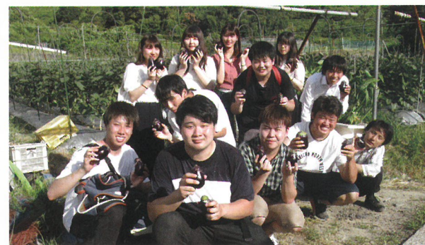
大阪観光大学RUSHプロジェクト & 共栄大学☆チーム内牧

『くまとりグルメマップ』(part2 こだわりランチ・飲食店編)では、(part1 スイーツ&ベーカリー編)に続き)観光を学ぶ東西両学生チームが町内を巡りました。安心・安全な食材、健康志向の調理方法、空間へのこだわり、そして個性あふれる店主の皆さん、、、猛暑のなかでも楽しく調査・取材ができました。熊取グルメお楽しみください。ポナベティ!