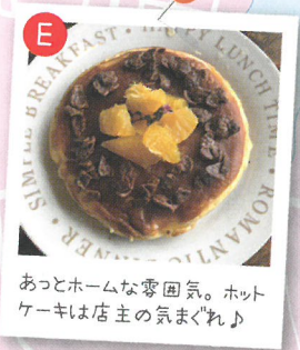
あっとホームな雰囲気。ホットケーキは店主の気まぐれ♪