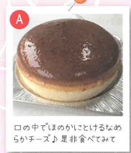
口の中でほのかにとけるなめらかチーズ♪是非食べてみて