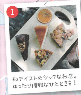
和テイストのツッペンのお店。ゆったり優雅なひとときを！