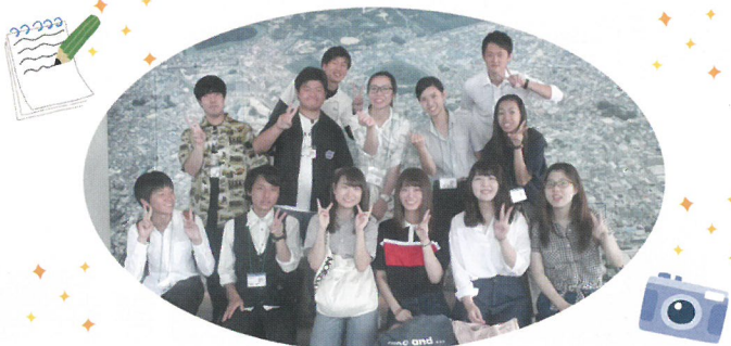
大阪観光大学RUSHプロジェクト&共栄大学学生有志

『くまとりグルメマップ』(part1 スイーツ&ベーカリー編)は、地元の若者ならではの視点で企画し完成させたものです。調査にはご縁のある関東の大学生にも参加してもらいました。東西両学生が町内のスイーツとパン屋さんを巡り、おすすめの商品を聞き、試食し、商品やお店のことをもっと知るために店主の方にもお話を伺いました。このマップ制作をとおして、地域の皆さんの暖かさも深く知ることが出来ました。熊取町の魅力がたくさんあったこのマップを手に、お店巡りをしてください！