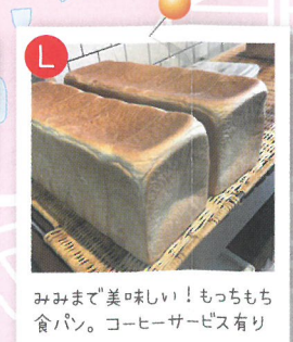
みみまで美味しい！もちもち食パン。コーヒーサーブス有り