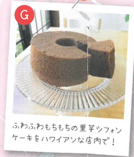
ふわふわもちもちの里芋ツッペンケーキをハワイアンな店内で！