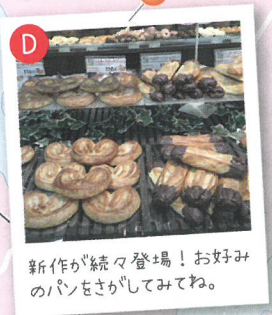
新作が続々登場！お好みのパンをさがしてみよう。