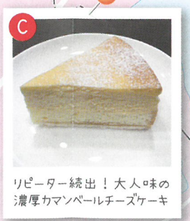
リピーター続出！大人味の濃厚カマンベールチーズケーキ