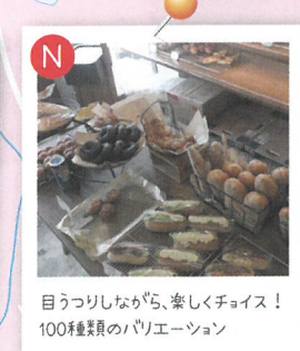
目うつりしながら、楽しくチョイス！100種類のバリエーション