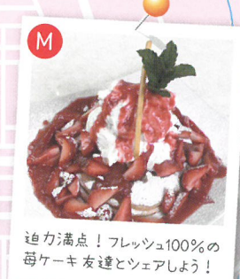
迫力満点！フレッシュ100%の苺ケーキ友達とシェアしよう！