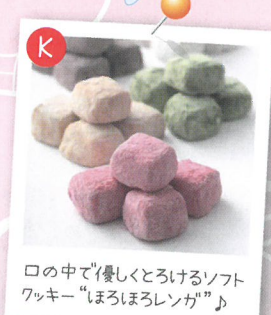
口の中で優しくとろけるソフトワッキー「まるほろレング」♪