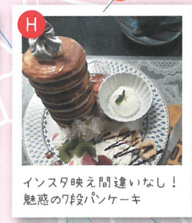
インスタ映え間違いなし！魅惑の7段パンケーキ