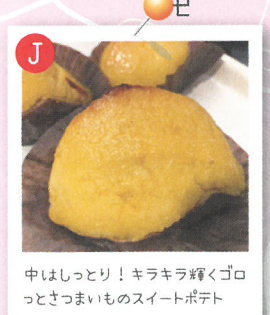
中はしっとり！キラキラ輝くゴロっとさつまいものスイーツポテト