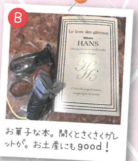
お菓子な本。開くとさくさくがっつり。お土産にもgood!