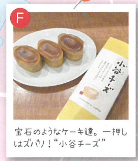
宝石のようなケーキ達。一押しはズバリ！「小谷チーズ」