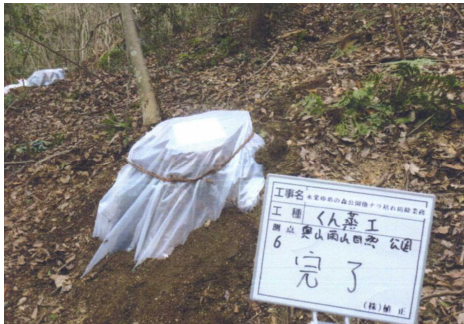
（事業1：ナラ枯れ防除の様子）