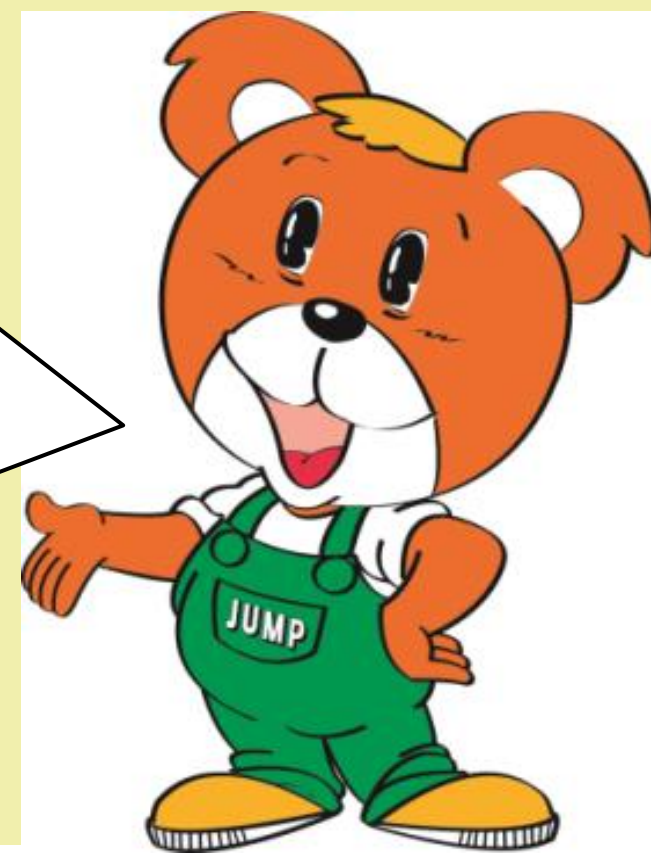
熊取町マスコットキャラクター (ジャンプ君)

リフレッシュリバー・くまとり推進会議主催により、生活に密接な繋がりのある主要3河川において、住民参加による清掃活動を実施し、河川愛護のボランティア精神を広く地域住民に浸透させ、河川環境の保全に努めています。