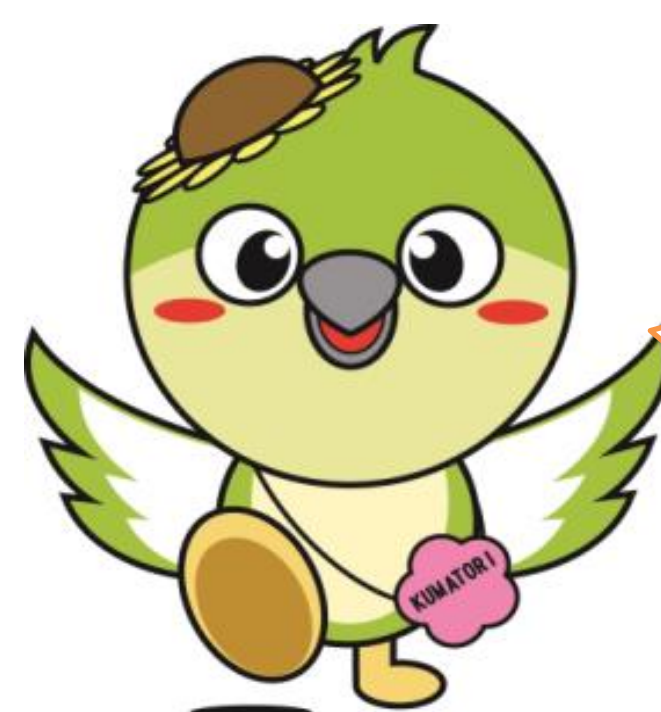
熊取町マスコットキャラクター (メジーナちゃん)