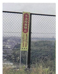
不法投棄禁止の 注意喚起看板設置 (つばさが丘北2丁目)