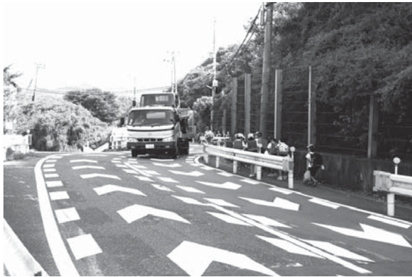
急カーブのためセンターラインぎりぎりの所を走行するトラックとガードレール内を通学する児童（ひまわりドーム近辺）