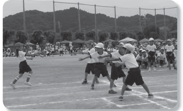
東小学校での運動会