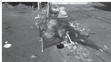
カラスが荒らした様子

答 電話申し込みの受け付け簡素化やインターネットでは年間6回の粗大・不燃ごみの祝日受け入れをしている。不当排出や不法投棄を助長するのでステーション方式は実施予定はない。