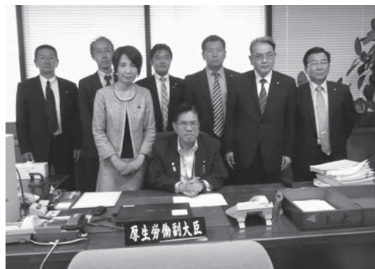
榎屋厚生労働副大臣に要望書を提出した時の様子

谷川秀善参議院議員事務所 北川イツセイ参議院議員事務所 内閣府・厚生労働省・経済産業省・文部科学省