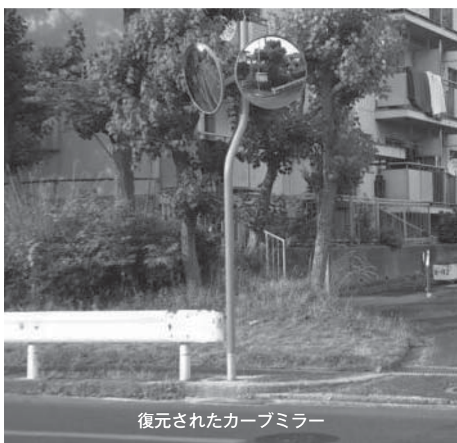
復元されたカーブミラー