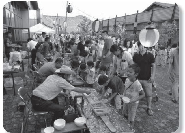
七夕 in 煉瓦館