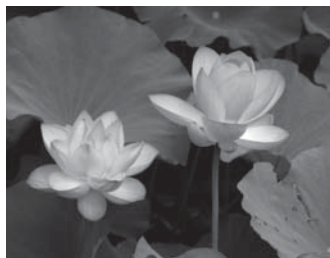
長池オアシスの蓮