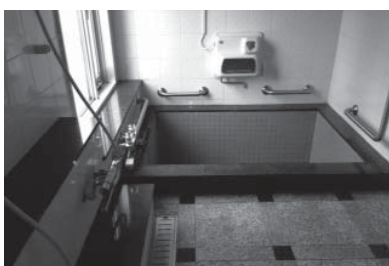
老人福祉センターのお風呂

答 一日30名程度で利用者が固定している。開館以来38年を経過。施設の老朽化が著しく、衛生・安全を考慮。施設については耐震審査を行いその結果を踏まえて検討する。 町長 廃止は決めています。