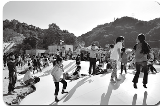
◀ 永楽ゆめの森公園