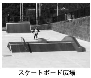
スケートボード広場

平成30年度からの広域化を円滑に進めるために平成27年度より対象医療費が1円以上に拡大され、新たな減免の拡充は考えていない。