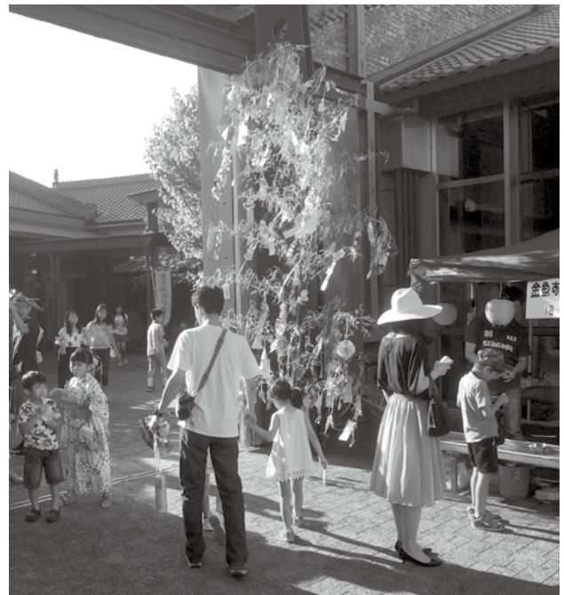
七夕 in 煉瓦館