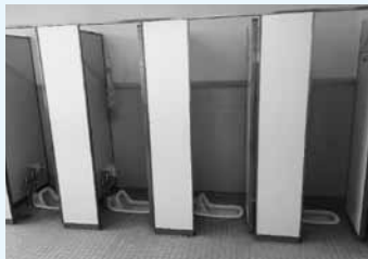
1階 職員室・体育館付近のトイレ