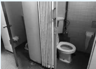
男女一ヶ所ずつの洋式トイレ

すべての設備等がかなり老朽化しており、早期に改善されるよう、引き続き議会が一丸となって強く要求していく。