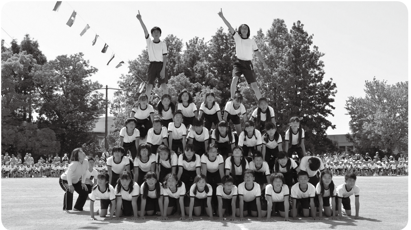
燃える魂 みんなの絆（西小学校運動会）

発行／熊取町議会 編集／広報委員会 熊取町野田一丁目1番1号 ☎072-452-9023