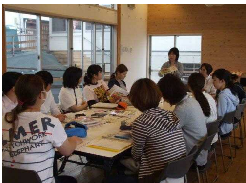
絵本リーダー会議