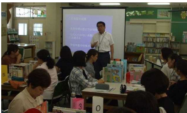
学校図書館研修会