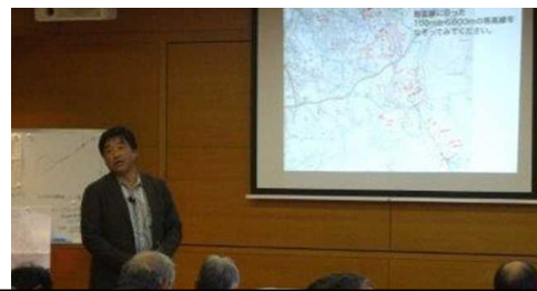
講演会:熊取町の大地の生い立ち(11/24)