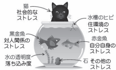
本人モード 結果画面(例)

ご本人の健康状態や人間関係、住環境などのストレス度や落ち込み度が、水槽の中で泳ぐ金魚などの絵になって表示されます。