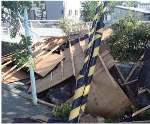
▲学校敷地内に飛んできた民家の屋根