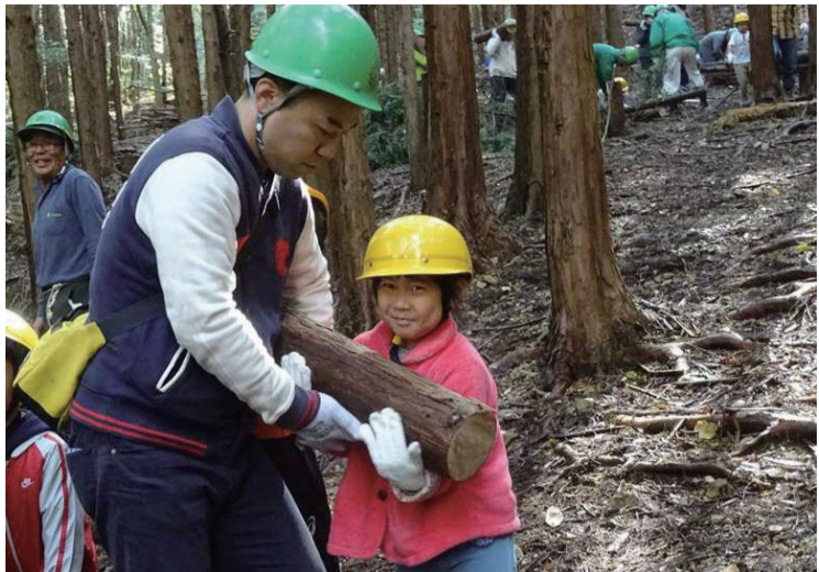
▲子どもたちも間伐を楽しんでいました！

住民提案協働事業「おおさか「山の目」」 里山クリーンハイキング ・間伐体験イベント