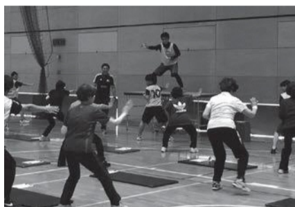
▲健康教室のようす

【日時】いずれも午後2時10分～2時40分【場所】サブアリーナ【必要な物】動きやすい服装・汗拭き用タオル・室内シューズ・飲料水