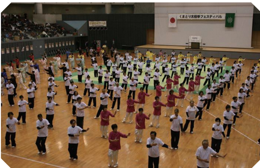
▲第18回くまとり太極拳フェスティバルのようす

【日時】11月11日(日)午後0時30分～5時※午後1時～3時に体力測定を実施 【場所】ひまわりドーム 【問い合わせ】生涯学習推進課スポーツ振興グループ ☎453・5428