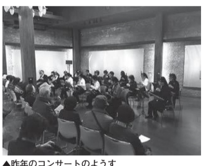
▲昨年のコンサートのようす

【応募資格】町内在住で音楽活動をしている団体または個人(ジャンルは問いません)【日時】平成31年3月9日(土)午後2時~【場所】交流ホール【定員】2組(申込多数の場合は抽選)【演奏時間】1組30分程度【申込期間】10月3日(水)~31日(水)午前9時~午後5時30分【申込方法】申込用紙(煉瓦館窓口に配置)※出演決定後、企画(広報原稿・ポスター作成)をはじめ、当日の進行に協力していただきます。【問い合わせ】生涯学習推進課文化振興グループ(教育・子どもセンター内)☎453-0600