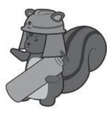
デザイン協力：HAL大阪

泉州南広域消防本部では、危険なボンベの撲滅に取り組みます。 発見したら ・ボンベが錆びていたり、変形していたら絶対に触らないでください。 ひまわりバスの運行時刻表を配布 今月号広報と同時に「ひまわりバス運行時刻表」を全戸配布しています。コースや時刻表の変更はありません。ぜひ、ひまわりバスをご利用ください。 問い合わせ 道路課管理交通グループ ☎452・6396