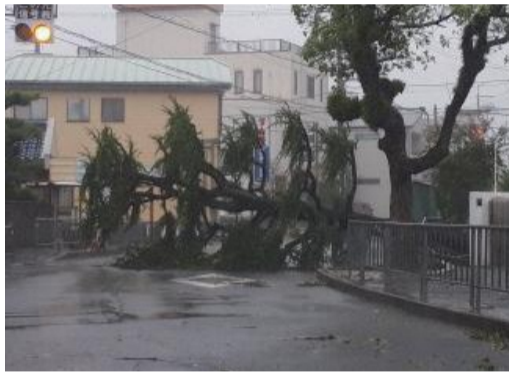
▲道路をふさいだ倒木