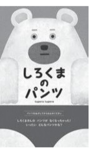
▲絵本「しろくまのパンツ」

【対象】町内在住の年中児~大人※保育なし【日時】11月18日(日)午後1時30分~4時【定員】80人(先着順)【持ち物】のり、はさみ【場所】2階ホール【申込開始日】10月13日(土)午前10時~