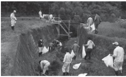
▲一昨年の河川清掃の様子(見出川)