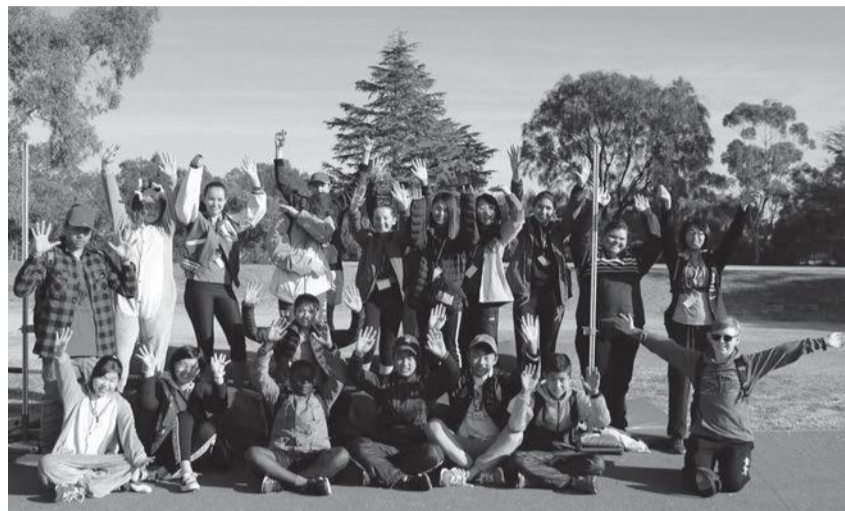
▲たくさんの友情がめばえ、貴重な体験となりました！

熊取町派遣団は姉妹都市ミルデューラ市から元気に帰国しました。子どもたちはチャフィ中等カレッジを訪問し、ホームステイなどを通じて現地の人々と友好を深めました。交流のようすは、煉瓦館ギャラリーロードで、10月2日(火)～25日(木)まで紹介するほか、町ホームページでもご覧いただけます。