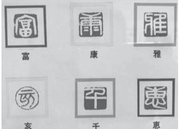
▲篆刻体験講座の参考作品

● 篆刻体験講座 【対象】町内在住・在勤・在学の方【日時】11月29日、12月6日(全2回木曜日)午後1時30分~3時30分【場所】3階実習室【定員】10人(先着順)【受講料】無料(材料費800円必要。10月末日までに公民館事務所にご持参ください。また、申し込み時に彫ってみたい一字をお申し出ください)