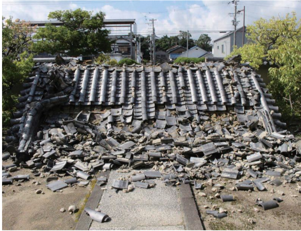
▲暴風により倒壊した重要文化財 中家住宅の門 ※中家住宅は当分の間、休館させていただきます。