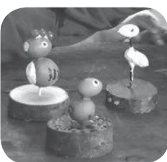
▶ドングリクラフトできましたよ!