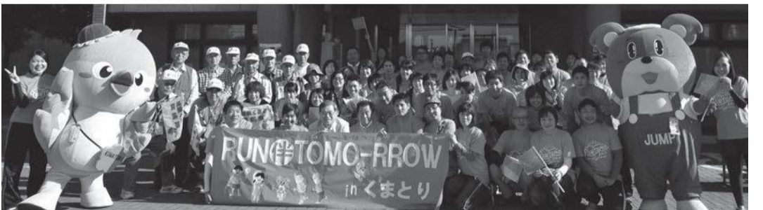
▲RUN伴でみんながひとつに!

● リレー 七山病院と弥栄園の2カ所で、午前10時30分にスタートし、熊取ふれあいセンターがゴール。 コース ①七山病院→町立北保育所