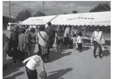
▲昨年の花苗プレゼントの様子