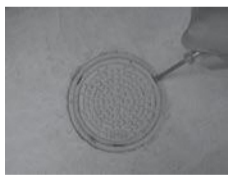
▲汚水ますの開け方

下水の流れが悪くなった、詰まったときには、町排水設備指定工事店に点検・清掃を依頼(有償)してください。