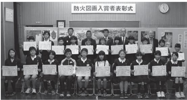
防火図画入賞者表彰式