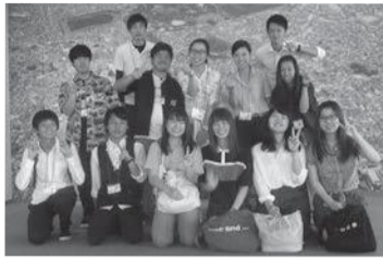
▲プロジェクトメンバーのみなさん