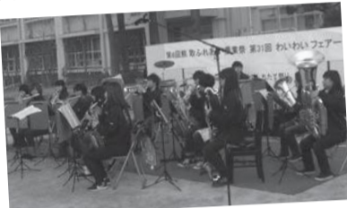
▲ふれあい農業祭でのステージ