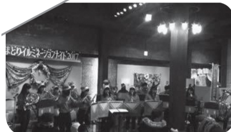
▲大阪観光学大学吹奏楽部