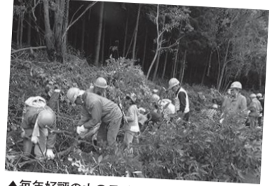
▲毎年好評の山の日イベント