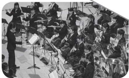
▲熊取中学校吹奏楽部