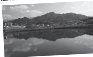
▲奥山雨山自然公園周辺

町が募集したテーマのうち、「熊取町の魅力を町内外に発信する熊取町プロモーションバスツアー事業」は応募がありませんでした。