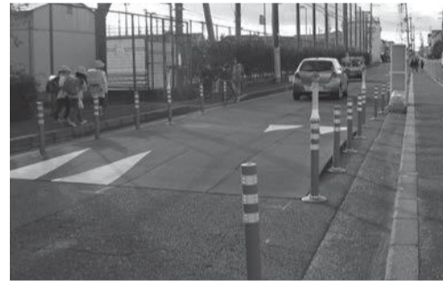
▲ハンブの設置イメージ(久保変電所前に設置します)