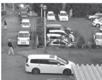
▲年末は大渋滞します

・平日(可燃、粗大・不燃、資源ごみ) 午前8時30分～11時45分、午後0時45分～4時 ・土曜日(可燃ごみのみ) 午前8時30分～11時45分