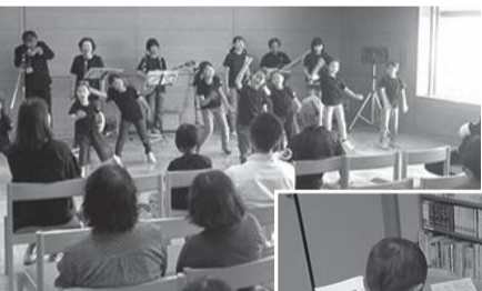
▲子どもたちだけで手話歌(手話歌発表)

参加されたみなさんと、各コーナーでボランティアとふれあいながら、楽しい交流ができました。