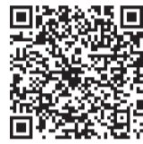
▲気象庁ホームページ

平成30年7月豪雨での教訓を踏まえ、土砂災害、洪水、河川の氾濫などの際に、住民がとるべき行動を 直感的に理解できるように、市町村による避難勧告などの避難情報や、気象庁などによる防災気象情報が5段階の「警戒レベル」を用いて伝達されることになりました。 くわしくは、気象庁ホームページ「防災気象情報と警戒レベルとの対応について」をご覧ください。