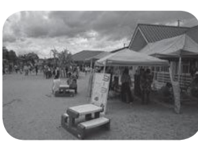
▲なつまつりのようす

役場庁舎・熊取ふれあいセンターで「ダイヤルイン(直通電話)方式」を導入しています。 ご用件のある課・グループなどに直接つながります。ぜひご利用ください。