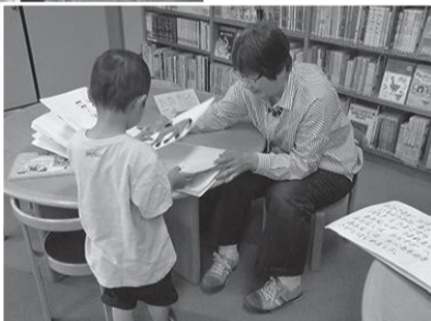
▲さわって何かわかる?(さわる絵本体験)