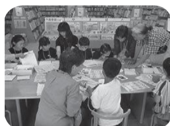
▲むずかしいかな?(点字体験)

5月19日、熊取町ボランティア連絡会は、ひとりでも多くの方に活動内容を知り、関心を持っていただけるようにフェスティバルを開催しました。