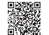
消費者庁のキッチンゴミ回収場 (リメイクレジなど多数掲載)

熊取町では、「毎週月曜日は食べマンデー！」をキャッチコピーとし、週に一度（月曜日（マンデー））以外でもかまいません。は各ご家庭で食品ロスの削減についてお考えいただき、食料品をロスなく食べきるための取り組みを推進しています。 家庭でできる食品ロス対策 ・ 買い物前に冷蔵庫をチェック！ ・ 「安いから」とあれこれ買わない ・ 消費期限はこまめにチェック ・ 野菜や果物の皮は薄くむく ・ 残っている食材から使う