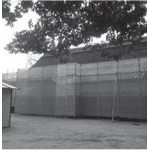
▲復旧工事の中家住宅(5月下旬撮影)

昨年9月の台風第21号の影響により、中家住宅の表門が倒壊するなどの被害がありました。現在、文化庁の国庫補助金を受けながら、復旧工事に取りかかっています。すでに足場が設置され、作業が本格化しています。 なお、令和2年3月31日