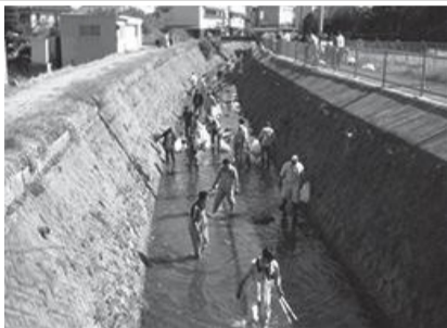
▲昨年の河川清掃の様子

町では「リフレッシュユリバー・くまとり推進会議」が中心となり、平成12年度から住民のみなさんにもご参加いただいで、河川美化および河川愛護啓発に取り組んでいます。今年も、7月にJR熊取駅周辺での啓発を、また10月には、住民のみなさんにご参加いただき河川清掃活動を実施する予定です。みんなで力を合わせてゴミをなくし、美しい川を取り戻しましょう。