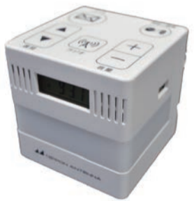
▲「防災情報サービス」専用端末