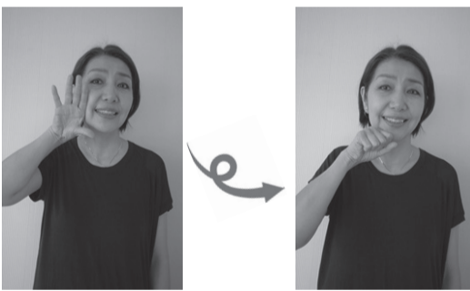
頬にそわせて開いた手のひらをにぎりながら前方斜め下に移動させる。