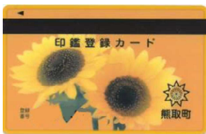
印鑑登録カード(住民カード)