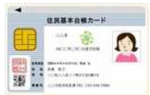
住民基本台帳カード