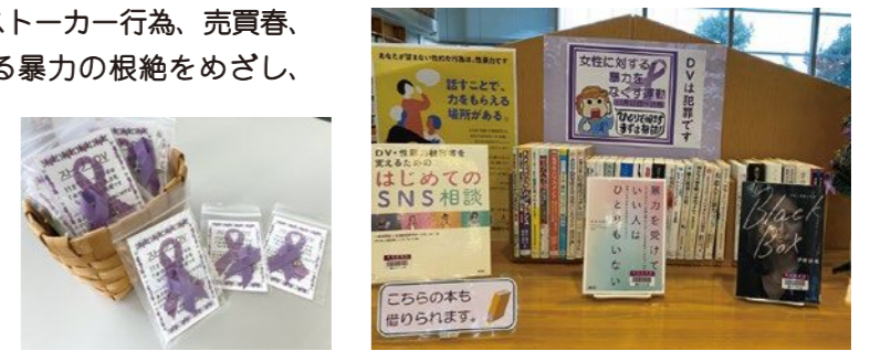
令和4年度の図書館での展示のようす

熊取町では、11月中、図書館において、DVに関する書籍の展示をおこなっています。また、女性に対する暴力根絶のシンボルである「パープルリボン」を、役場や図書館等で配布しています。